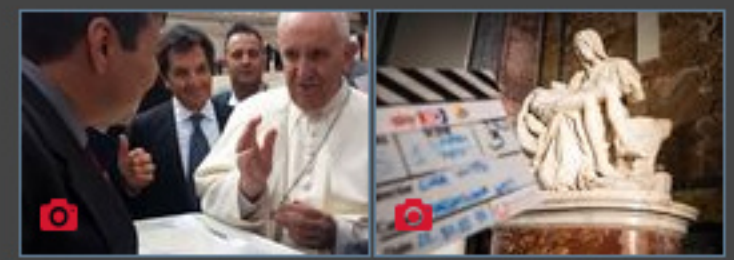
I detenuti di Opera donano al Papa le ostie prodotte in carcere | Al cinema i segreti delle Basiliche papali di Roma in 3D